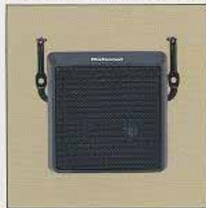
より鮮明な通話が聞こえる 外部スピーカ EF-S1027AZ

COCOM マークのある機種は“外国為替及び外国貿易管理法”で定められた戦略物資に該当する商品です。